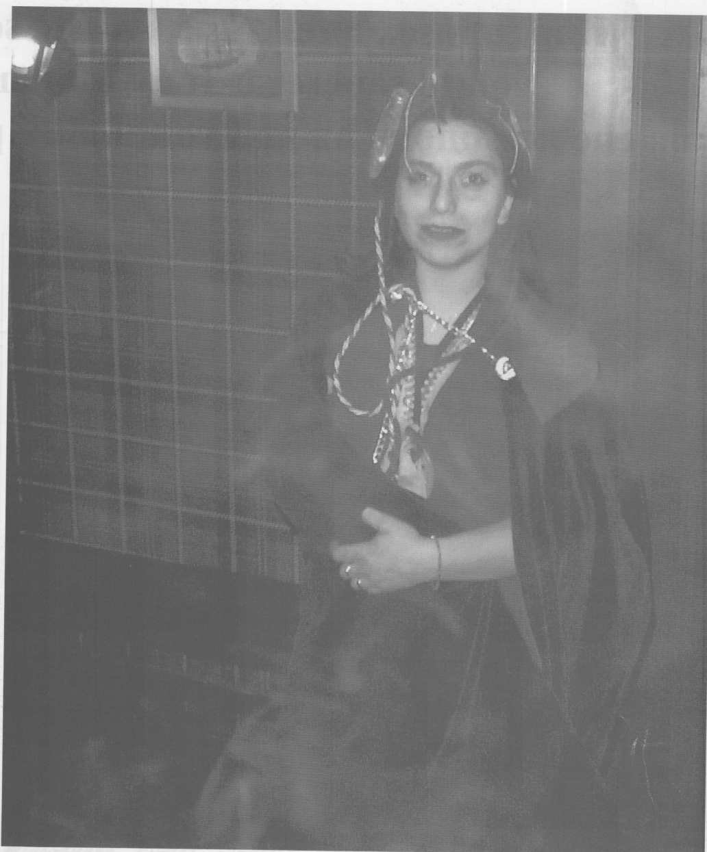
Lo Vicario avvolto dalle nebbie di Avalon

"È tutta una fetta! Il bar più frequentato dai Goliardi è ancora aperto!!!"