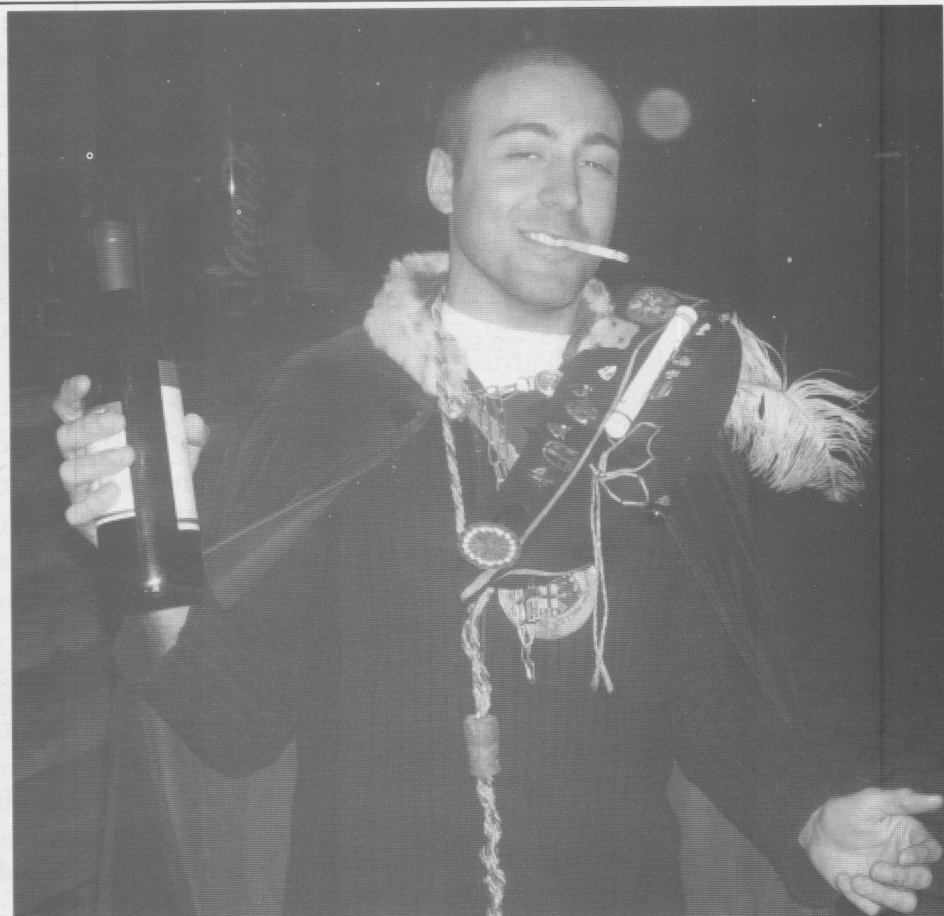
Genuflexus Plurijectans in Scafandro Obscuro Eccellentissimo Duca