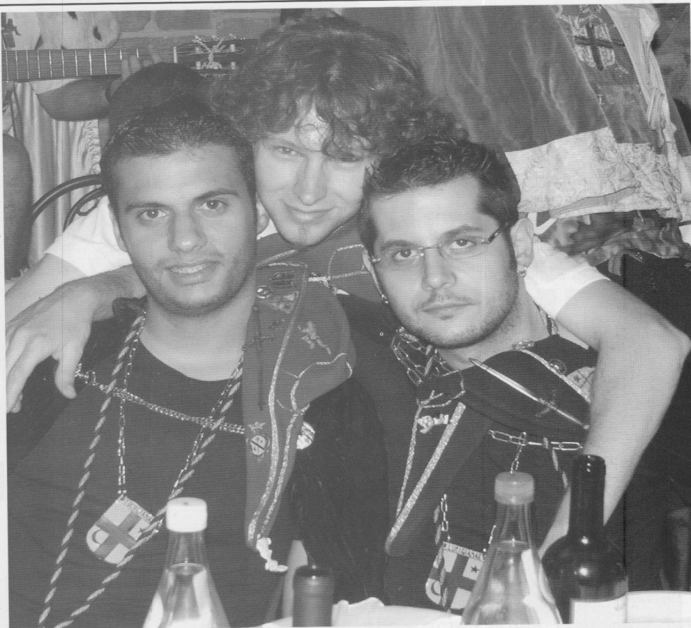
Da Destra a Sinistra o Viceversa: Mimì, Cocò e Cacamùcazz'!!!

Prova Schiacciante già acquisita agli atti!!!