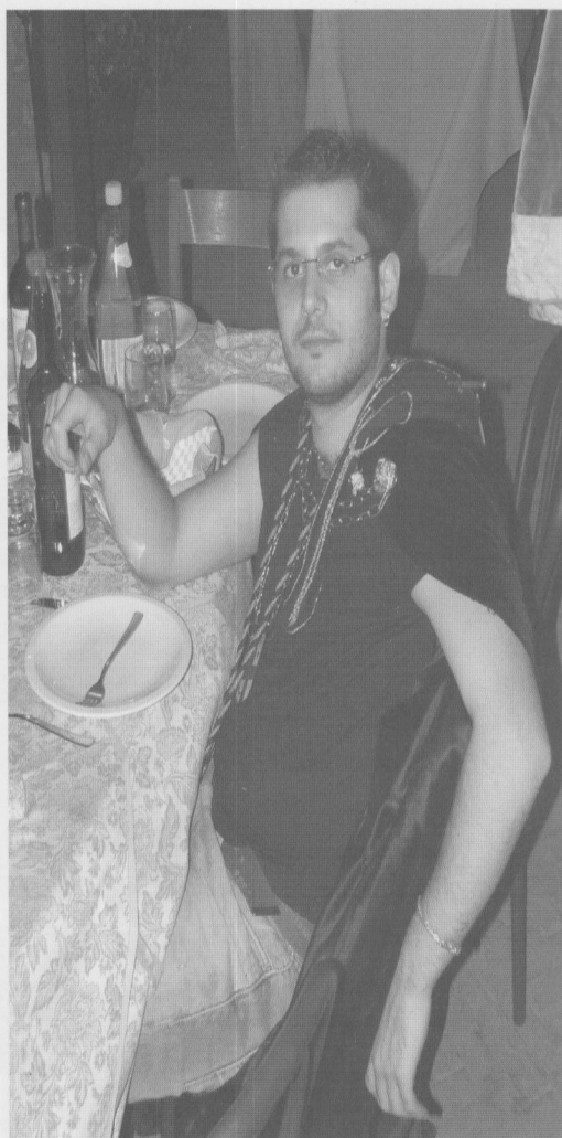
Dante in un momento di ciecità alcolica!