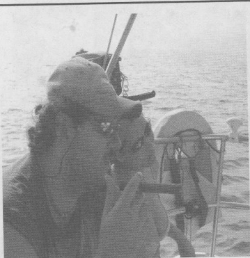
Il Duca Lestat mentre si gode i soldi della questua di quest'anno.

In questo modo ad un Duca segue un Duca e si arriva fino a questo 2004 e saranno, come sempre saranno le Feriae Matricularum Parmigiane per i Parmigiani, un tempo in cui il Goliarda estero è gradito ospite nel rispetto del fatto che siamo a Parma ed anche se a volte, per questo, all'ospite gli sigano i maroni va ricordato che se sulle terre altrui non vantiamo (per ora) pretese, sulle Nostre siamo Padroni Assolutie ci piace di goderne fino in fondo assaporando il dolce gusto di pianure colline e